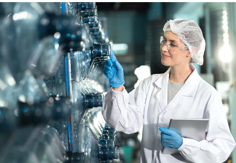
■ Abb. 1: Echtzeitdaten aus der Getränkeproduktion werden für den Vertrieb vor Ort beim Kunden aus dem Lebensmittelhandel für verlässliche Lieferterminplanungen über Mobilgeräte zugänglich.

Vom einfachen Sensor bis zum komplexen ERP erfassen Systeme immer mehr Daten und erzeugen eine Informationsflut – gigantisch und unstrukturiert. Tools wie die SAP Analytics Cloud kanalisieren die Daten, veranschaulichen Zusammenhänge und brechen die Komplexität auf übersichtliche Berichte herunter. Vorgefertigte Dashboards von Prisma beschleunigen die überzeugende User Experience.