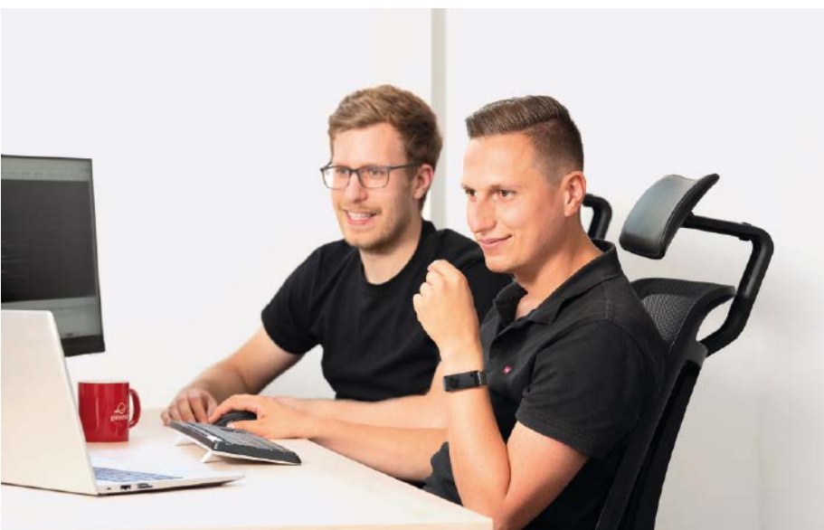
■ Abb. 3: Die SAP-Profis modifizieren die vorhandenen SAP-Module ganz nach Wunsch – für eine individuelle Lösung.

Das übersichtliche Dashboard von Prisma zeigt nicht nur die Live-Daten, sondern liefert direkt Erklärungen zu den Werten. „Das ist besonders hilfreich für Personen, die nur selten mit der SAP Analytics Cloud arbeiten. Sie können dadurch auf einen Blick erkennen, was die einzelnen Kennzahlen bedeuten“, freut sich der Versandleiter.